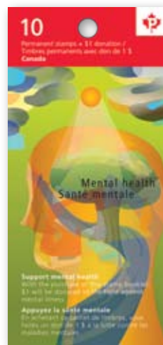
Booklet of 10 stamps Carnet de 10 timbres 413752111 $ 6 40